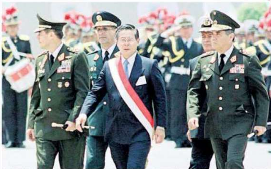
ORIGEN QUESTIONABLE. Morales reconoció que la Constitución de 1993 se concibió en un régimen autoritario, el de Fujimori.

—Quiénes dicen eso no conocen, no revisaron bien la Constitución. Es un sector de docentes de Derecho Constitucional de una universidad limeña que tiene esa tesis, la de que el Congreso tiene el arma de la vacancia y el Ejecutivo la disolución. Desde la teoría, eso es falso, la vacancia tiene que ver con el estatuto presidencial, condiciones para elegir al presidente, sus atribuciones y cese del mandato. La denegación de confianza tiene que ver con la relación de gober-