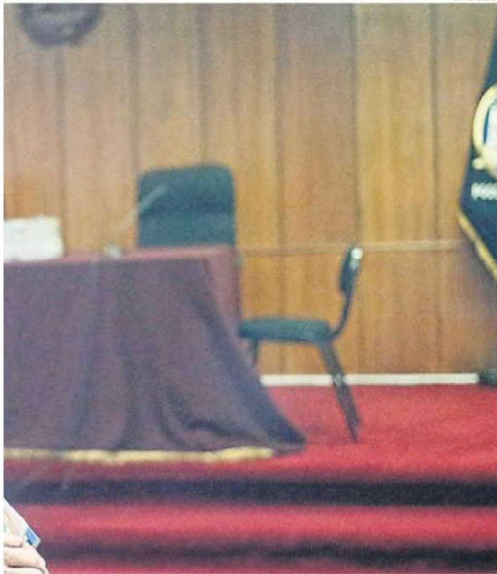
C y el inicio del trámite administrativo para su libertad.

internacional lo faculta a informar a la OEA de este hecho. En consecuencia, queda fuera de su competencia ordenar a un Estado, en supervisión de cumplimiento de sentencia, no ejecutar una sentencia de un tribunal nacional. En todo caso, la Corte queda facultada para dejar constancia de una resolución que se mantiene abierta al procedimiento de supervisión o, si fuera el caso, informar a la OEA".