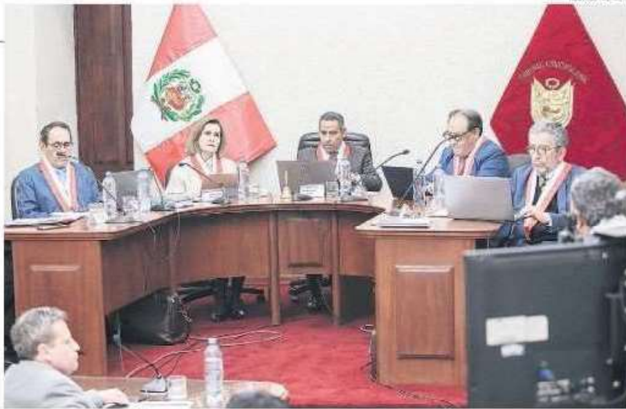
CONTRA LA LEY ORGÁNICA. Magistrados habrían votado incumpliendo normas internas del máximo órgano constitucional.

ciones que son aspectos procedimentales para un pronunciamiento de fondo, que, además, no fue materia de análisis en el primer auto de noviembre.