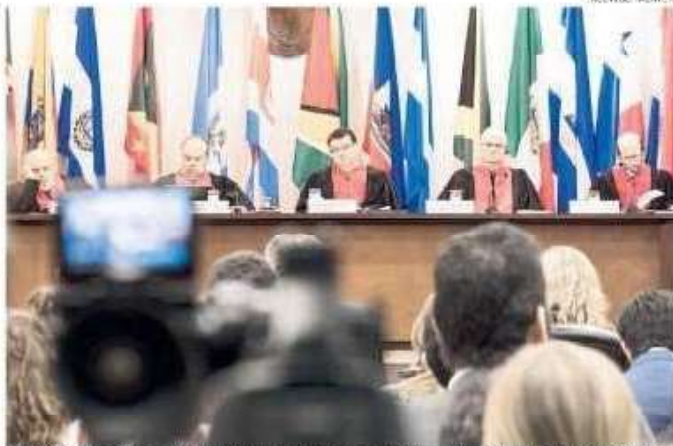
DE ACUERDO A LEY. Corte IDH ordenó al Estado abstenerse de implementar el indulto a Fujimori.

—Su propia lógica a la cual he calificado como formalidad procesal se ha presentado después. Nos piden que el TC nos pronunciamos sobre una decisión que es posterior a la sentencia. Por lo tanto, la aclaración no tiene nada que ver con eso. Es una muestra más de que mis colegas decidieron no pronunciarse sobre el tema solicitado,