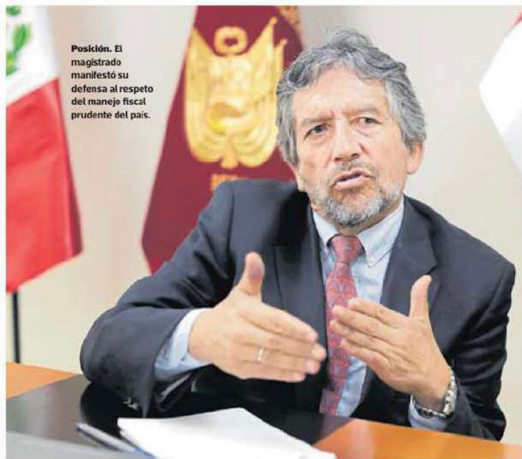
Posición. El magistrado manifestó su defensa al respeto del manejo fiscal prudente del país.

En primer lugar es que solo se deben devolver a los traba-