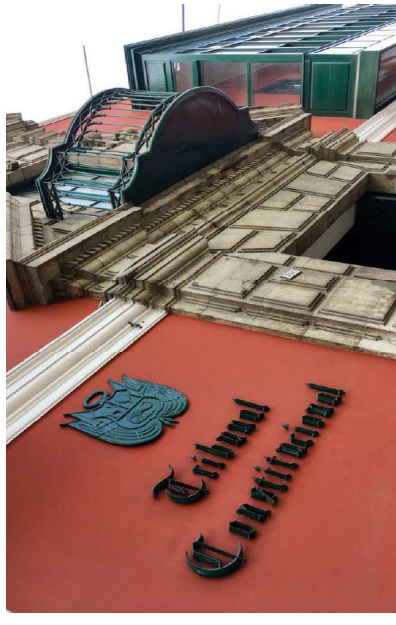
Magistrado Francisco Morales, ha iniciado una cruzada digital en el Tribunal Constitucional.