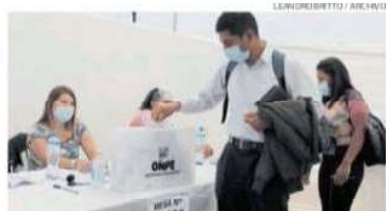
Morales pide sensatez para definir el adelanto de comicios.

En los próximos días o semanas, vamos a resolver el tema de la pildora del día siguiente, es un tema candente. Vamos a resolver el tema de Fonavi, tenemos que hacerlo. A unos les gustará, a otros no, pero lo que estamos haciendo es afirmando los criterios y las interpretaciones constitucionales que el colegiado debate y es de nuestra competencia. —