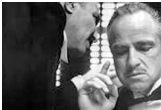
Bonasera hablándole al oído al “Padrino”