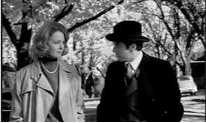
Kay Adams y Michael Corleone

Luego de asesinar a Virgil “El Turco” Sollozzo y al capitán McCluskey Michael huye a Sicilia. Se casa ahí con Apolonia y enviuda debido a la traición de Fabrizio, su guardaespaldas: el coche voló en pedazos con Apolonia adentro. El atentado salió mal. Debido a las gestiones de su padre en América, quien se reunió con los miembros de la “comisión” 39 para lograr un acuerdo de paz, consigue el “salvoconducto” para regresar a su país sin que corra riesgo su vida. Es famoso el monólogo que dio Don Vito para obtener la inmunidad de su hijo: